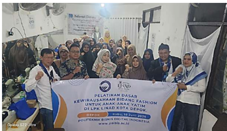
Gambar 1. Pelaksanaan Pelatihan

Untuk menjamin keabsahan data, penelitian ini menggunakan teknik triangulasi sumber dan metode. Triangulasi sumber dilakukan dengan membandingkan informasi yang diperoleh dari berbagai informan, sementara triangulasi metode dilakukan dengan membandingkan hasil observasi, wawancara, dan dokumentasi. Selain itu, peneliti juga melakukan member check , yaitu mengonfirmasi kembali hasil temuan kepada informan agar data yang diperoleh valid dan dapat dipercaya.